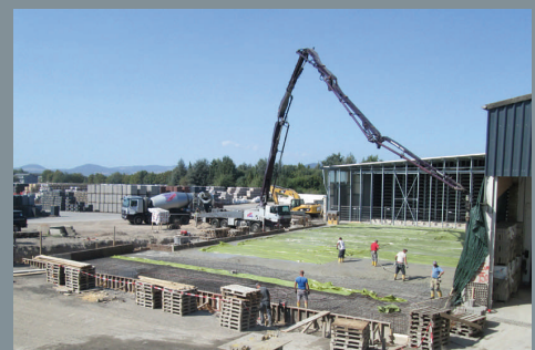
Die Bauarbeiten schreiten voran.

Wie Sie vielleicht wissen, erweitern wir in diesem Jahr die Kapazitäten an Trocknungsplätzen für unsere Steinfertigungsanlage. Unsere Baustoffe können dann nach der Produktion noch länger im Aushärtungsprozess ruhen. Die erste von zwei neuen Trocknungskammern ist bereits voll in Betrieb gegangen. Mittlerweile wurde auch die Bodenplatte der zweiten Kammer gegossen, so dass die Arbeiten hier schnell voranschreiten. Noch vor dem Winter wollen wir auch die zweite Kammer in Betrieb nehmen. Wir freuen uns schon darauf, Ihnen die neuen Hallen dann zu präsentieren.